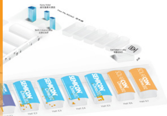
展馆分布图 Exhibiting Space

2,000 Exhibitors 4,000 Booths 50,000 Visitors 150 Government Delegations 80,000 sq.m. Exhibiting Space